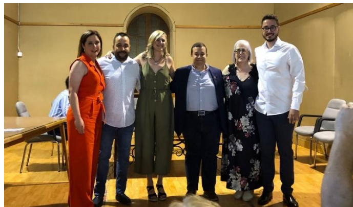
Nuevo equipo de gobierno.

donde la exalcaldesa NO RECONOCIÓ como válido el gobierno en coalición del nuevo ayuntamiento. Un gobierno formado según marca la Constitución en un sistema de Democracia Parlamentaria, tratando de justificar lo injustificable de sus malas prácticas (que la Constitución se puede interpretar, ejemplo de buena gestión).